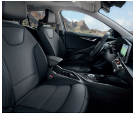
Čalúnenie sedadiel v kombinácii látky / umelá koža s čiernym interiérom (Gold)