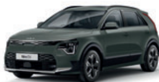
Cityscape Green (metalický lak)