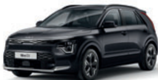
Aurora Black Pearl (perleťový lak)