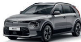
Steel Gray (metalický lak)