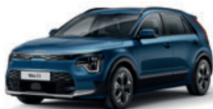
Mineral Blue (metalický lak)