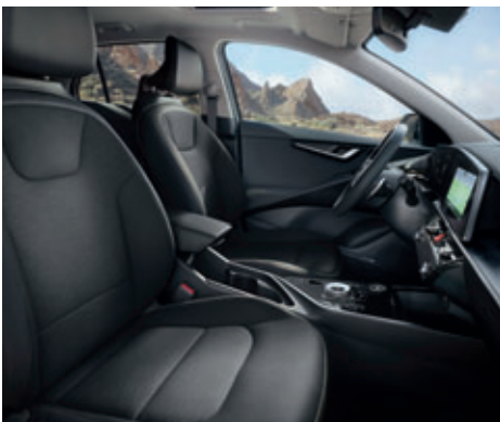
Čalúnenie sedadiel umelou kožou so šedým interiérom (Platinum)