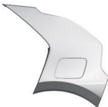
Steel Gray (kombinovateľné s lakom karosérie Snow White Pearl, Aurora Black Pearl a Interstellar Gray)