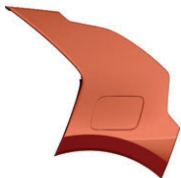
Orange Delight (kombinovateľné s lakom karosérie Aurora Black Pearl, Interstellar Gray a Steel Gray)