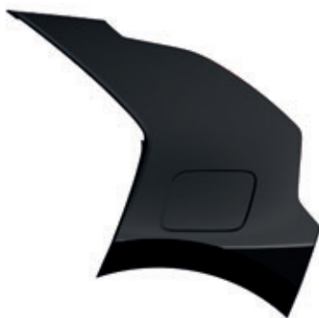
Aurora Black Pearl (kombinovateľné s lakom karosérie Snow White Pearl, Mineral Blue, Interstellar Gray, Runway Red, Steel Gray a Cityscape Green)