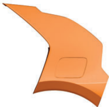
Tangerine (kombinovateľné s lakom karosérie Snow White Pearl)