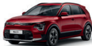
Runway Red (metalický lak)