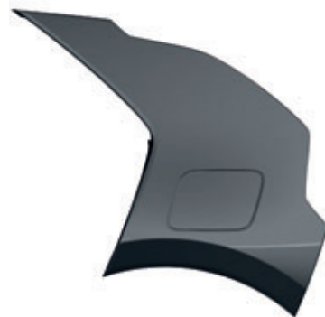
Interstellar Gray (kombinovateľné s lakom karosérie Snow White Pearl a Steel Gray)