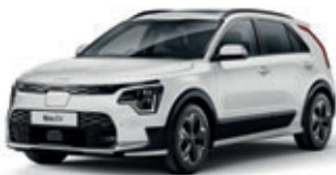
Snow White Pearl (perleťový lak)