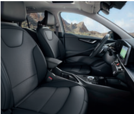
Čalúnenie sedadiel v kombinácii látky / umelá koža so šedým interiérom (Gold)