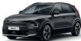
Interstellar Gray (metalický lak)