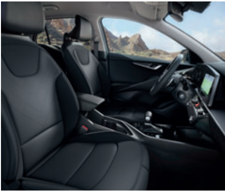
Látkové čalúnenie sedadiel s čiernym interiérom (Silver)