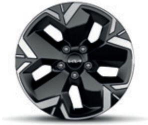
17-palcové disky kolies z ľahkých zliatin (pneumatiky 215/55 R17)