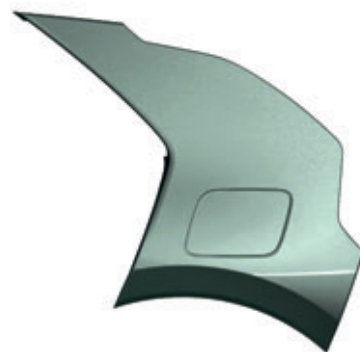
Cityscape Green (kombinovateľné s lakom karosérie Snow White Pearl a Steel Gray)