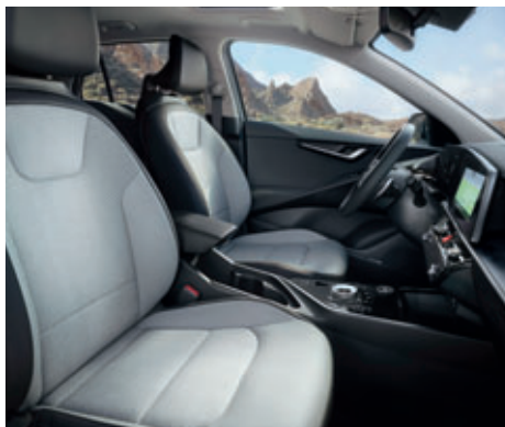
Čalúnenie sedadiel svetlosivou umelou kožou so šedým interiérom (Platinum)