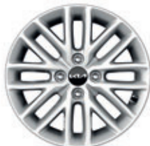
15-palcové disky kolies z ľahkých zliatin (pneumatiky 185/65 R15) Extra / Gold