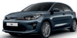
Smoke Blue (metalický lak)