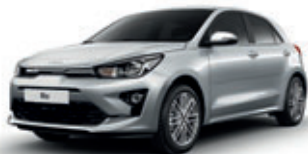
Silky Silver (metalický lak)