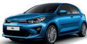
Sporty Blue (metalický lak)