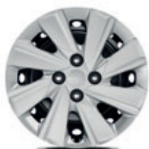
15-palcové oceleové disky kolies s okrasnými plastovými krytmi (pneumatiky 185/65 R15) Silver