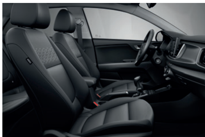
Látkové čalúnenie sedadiel (Gold)