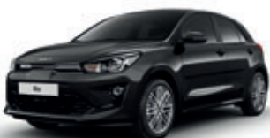
Aurora Black Pearl (perleťový lak)