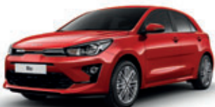
Signal Red (metalický lak)