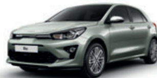
Urban Green (metalický lak)