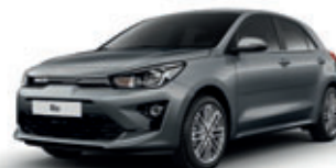
Perennial Grey (metalický lak)