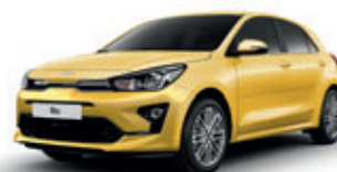
Most Yellow (perleťový lak)