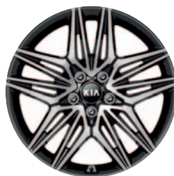
225/40R predné 255/35R zadné 19-palcové disky kolies