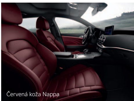
Červená koža Nappa