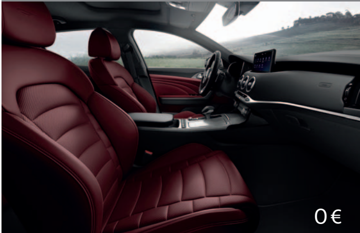
Červená koža Nappa