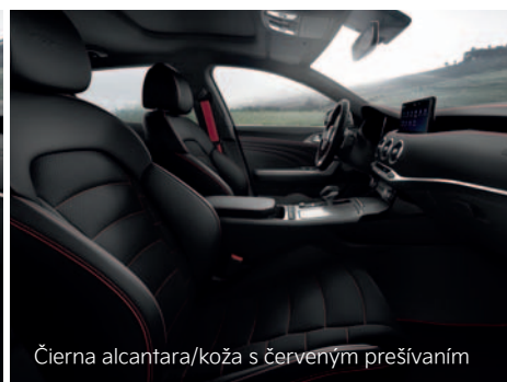
Čierna alcantara/koža s červeným prešívaním