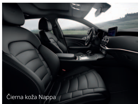
Čierna koža Nappa