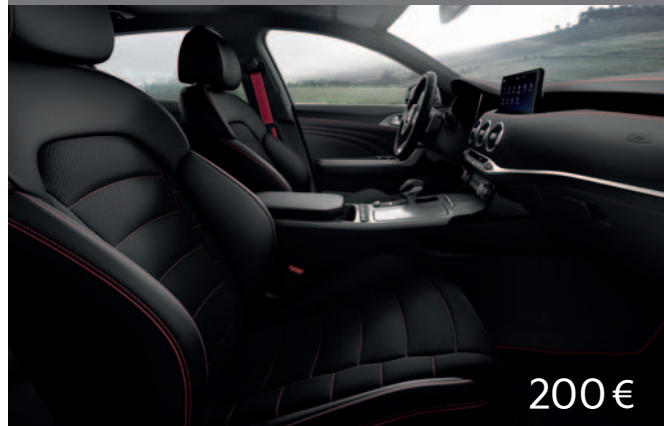
Čalúnenie alcantara / koža s červeným prešívaním a bezpečnostnými pásmi