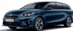
Cosmo Blue (metalický lak)