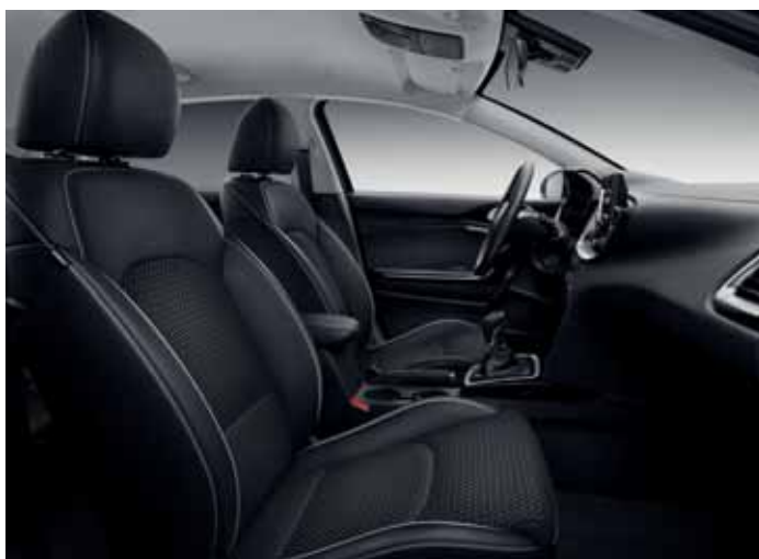
Čierna látka / koža