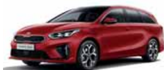
Infra Red (metalický lak)