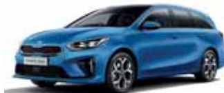
Blue Flame (metalický lak)