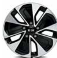
205/55R16-palcové disky kolies z ľahkých zliatin / Gold