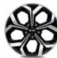
225/45R17-palcové disky kolies z ľahkých zliatin / Platinum