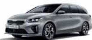
Lunar Silver (metalický lak)