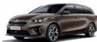
Cooper Stone (metalický lak)