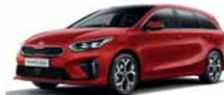
Track Red (nemetický lak)