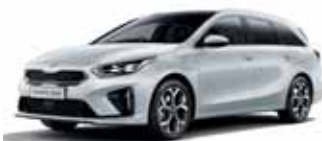
Deluxe White (metalický lak)