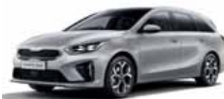
Sparkling Silver (metalický lak)