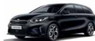
Black Pearl (metalický lak)