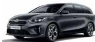
Penta Metal (metalický lak)